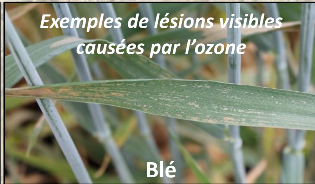
Exemples de lésions visibles causées par l'ozone