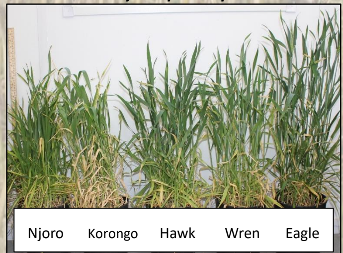
Njoro Korongo Hawk Wren Eagle

Korongo, cultivar le plus sensible à l'ozone des variétés testées